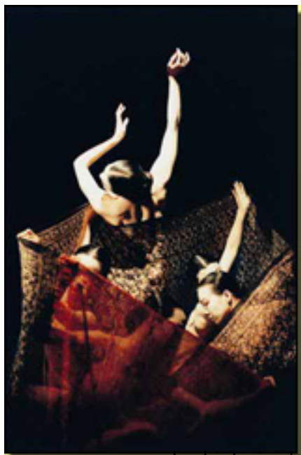
La historia del

Martes, 13 de Abril de 2010 09:23 - Actualizado Martes, 11 de Mayo de 2010 09:36