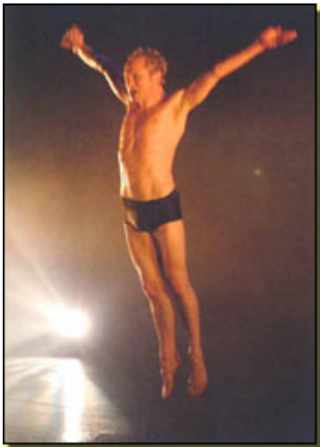
FRANK (REINO UNIDO)