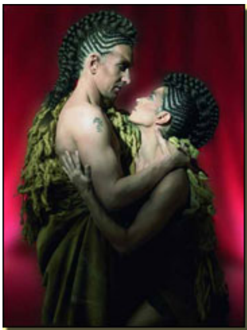
J. BOCCA/C. FIGAREDO