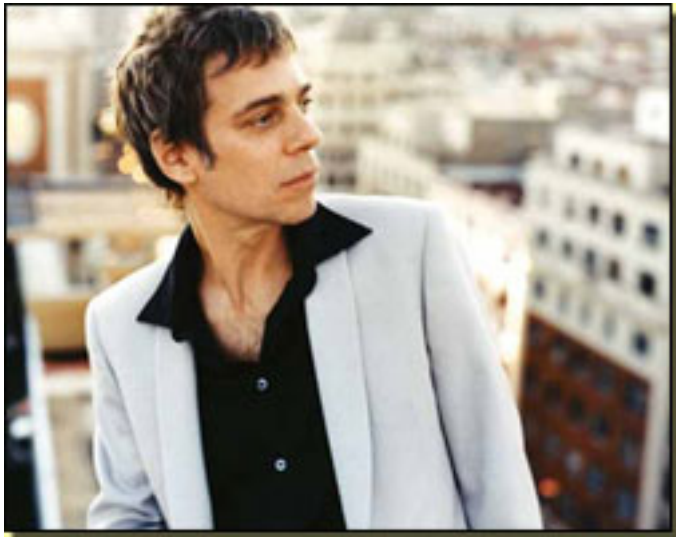
ARIEL ROT (ROCK)

Lunes, 12 de Abril de 2010 14:45 - Actualizado Lunes, 10 de Mayo de 2010 16:29