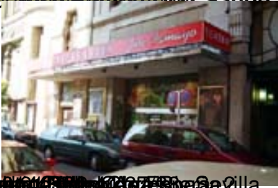
Exterior view of a building with a red sign