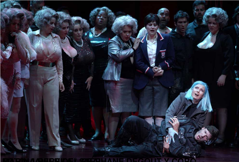
MATILDE ALBERDI, EL STEPHANE DEGOUT Y CORO