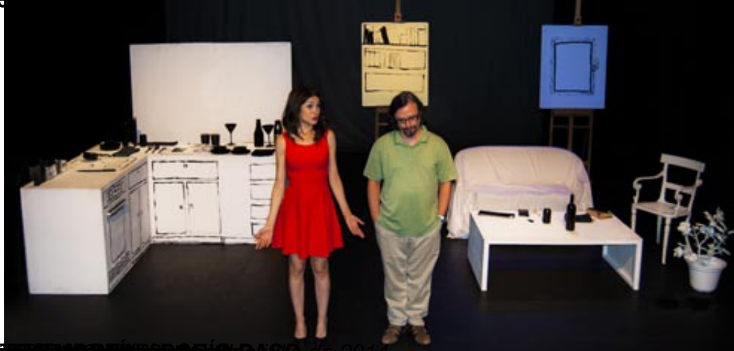
Jueves 11 de Septiembre de 2014