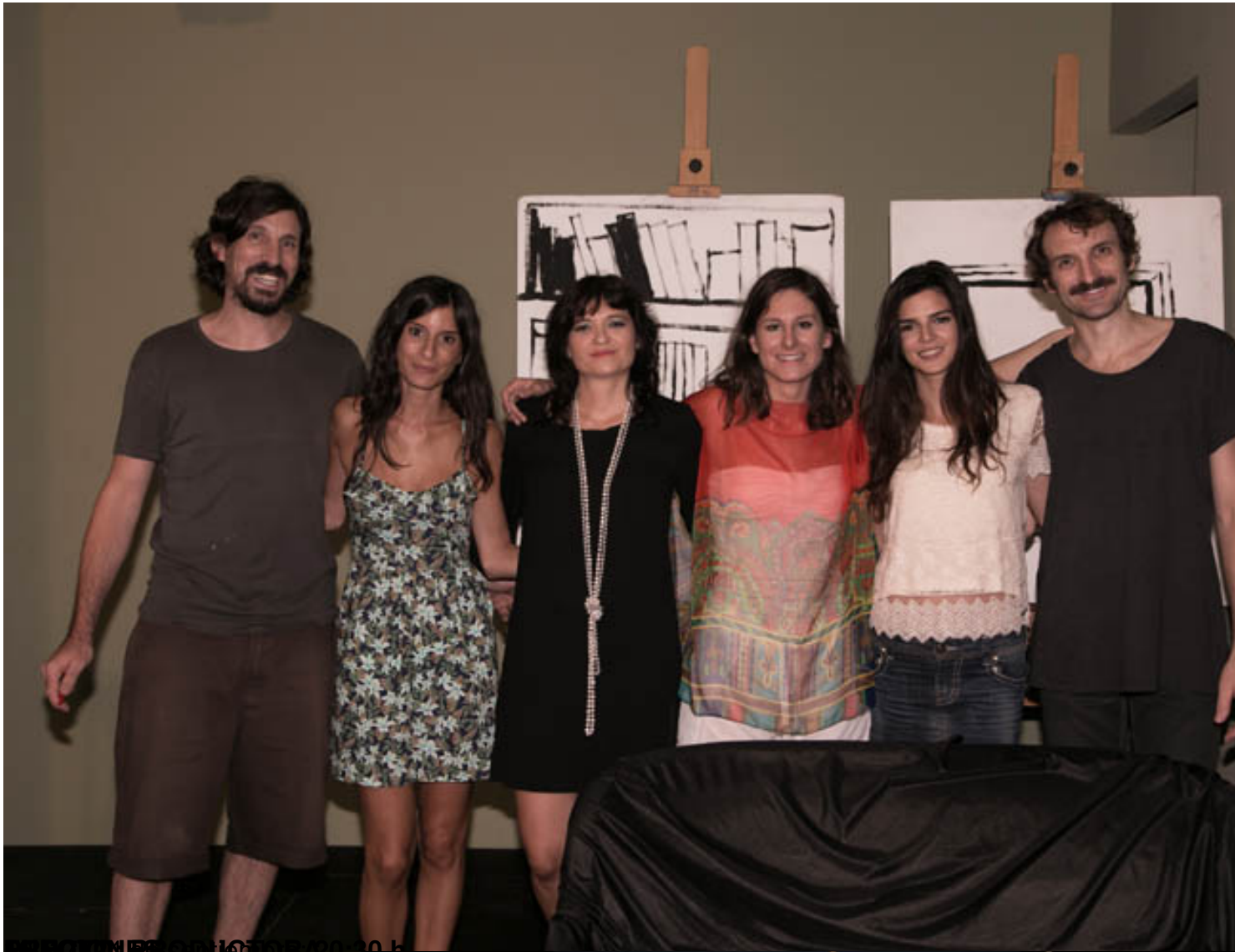
Jueves 11 de Septiembre de 2014

Lunes, 15 de Septiembre de 2014 09:33 - Actualizado Lunes, 15 de Septiembre de 2014 10:24