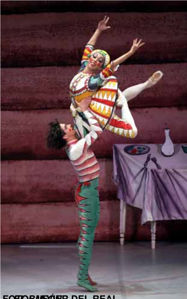
FOTOMOVIES DEL REAL