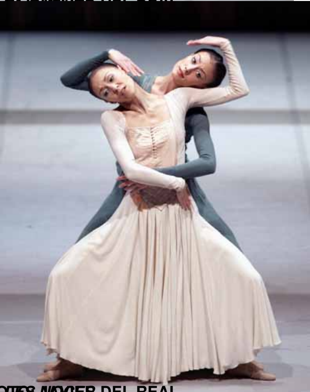
FOTOMOVIES DEL REAL