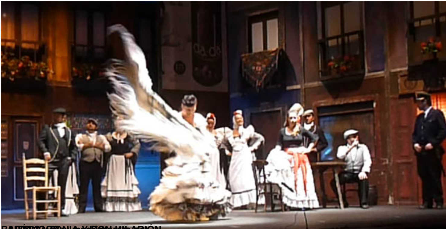
BARCELONA y BILBAO

Viernes, 22 de Agosto de 2014 15:47 - Actualizado Viernes, 22 de Agosto de 2014 22:57