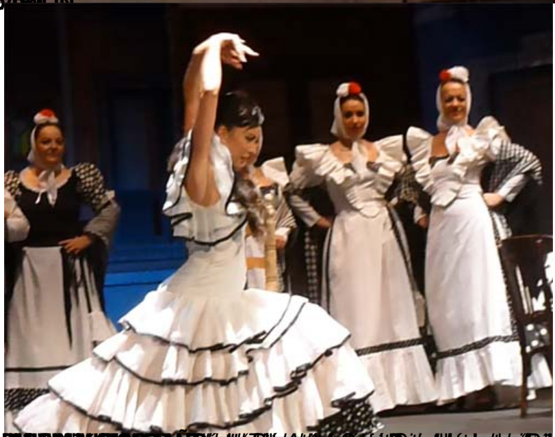
BARCELONA y BILBAO