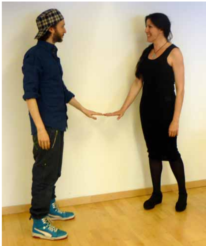
SIDI LARBI / MARÍA PAGÉS

estaba aquí entregando un premio como invitada de honor. Normalmente estoy un poco incómodo en estas ocasiones y recuerdo que se convirtió en algo memorable, especialmente por haberla conocido. Nos llevamos bien desde el principio, como si nos conociéramos desde hacía años. Hablamos de los movimientos de los brazos, del lenguaje, de los movimientos inventados, de las tradiciones, del ritmo... Nos encontramos muy a gusto en nuestras diferencias y vimos lo mucho que nos asemejamos en cuanto a las “constelaciones del corazón”. Yo ya estaba impresionado con ella como bailarina (la conocía como un ejemplo del flamenco desde hacía varios años), pero entonces la conocí como un ser humano maravilloso. Me envolvió con su calidez, su luz y su naturalidad.