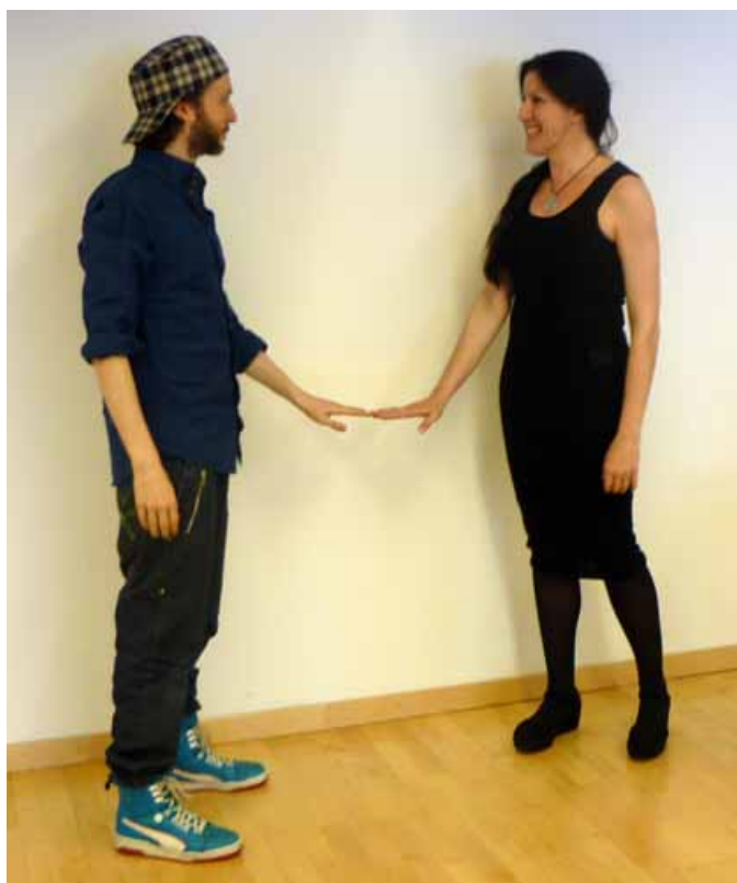
SIDI LARBI / MARÍA PAGÉS

estaba aquí entregando un premio como invitada de honor. Normalmente estoy un poco incómodo en estas ocasiones y recuerdo que se convirtió en algo memorable, especialmente por haberla conocido. Nos llevamos bien desde el principio, como si nos conociéramos desde hacía años. Hablamos de los movimientos de los brazos, del lenguaje, de los movimientos inventados, de las tradiciones, del ritmo... Nos encontramos muy a gusto en nuestras diferencias y vimos lo mucho que nos asemejamos en cuanto a las “constelaciones del corazón”. Yo ya estaba impresionado con ella como bailarina (la conocía como un ejemplo del flamenco desde hacía varios años), pero entonces la conocí como un ser humano maravilloso. Me envolvió con su calidez, su luz y su naturalidad.