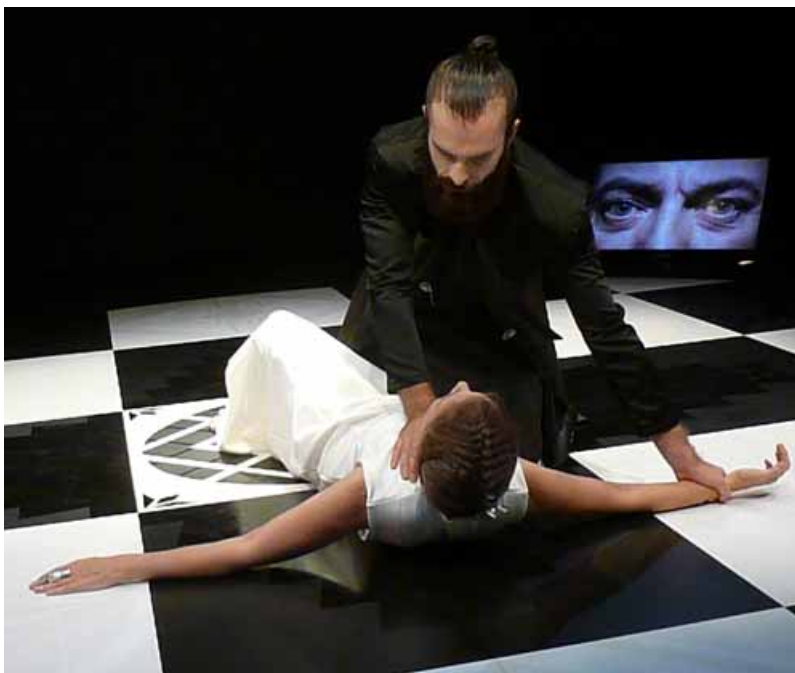
EVA GARCÍA / BORJA LUNA