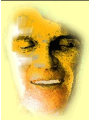
Más información de teatro.net Novecento. Baricco. Rellán. Raul Entrevista &