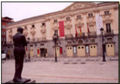
El teatro en Cataluña Señala de Cataluña