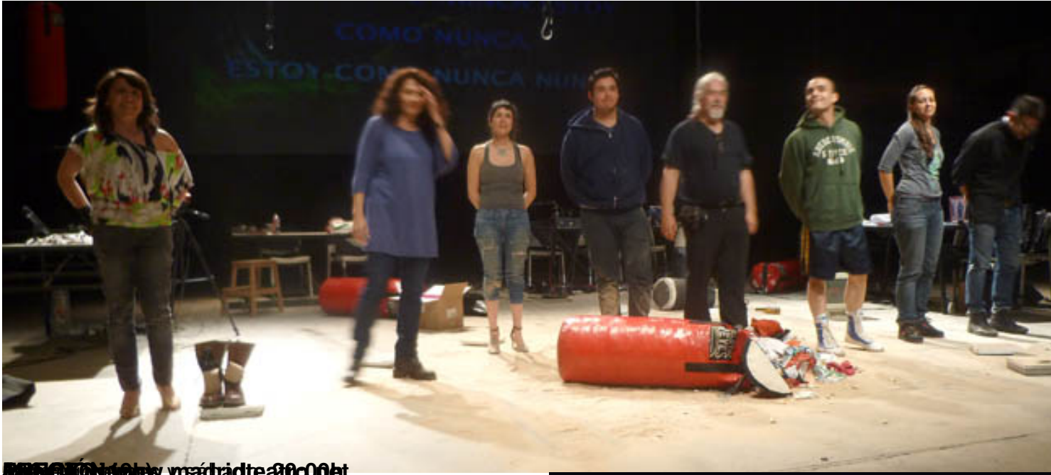
1996 - 1997 y más tarde 2000 et