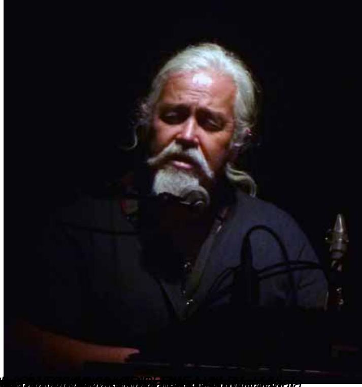
1996 - 1997 y más tarde 2000 et