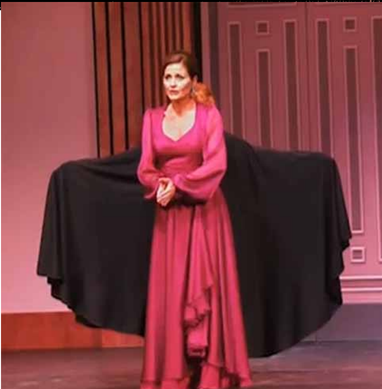
Norma Aleandro, 2015