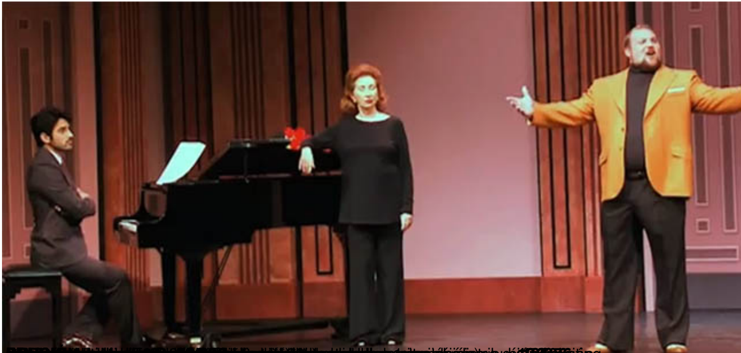
Norma Aleandro, 2015