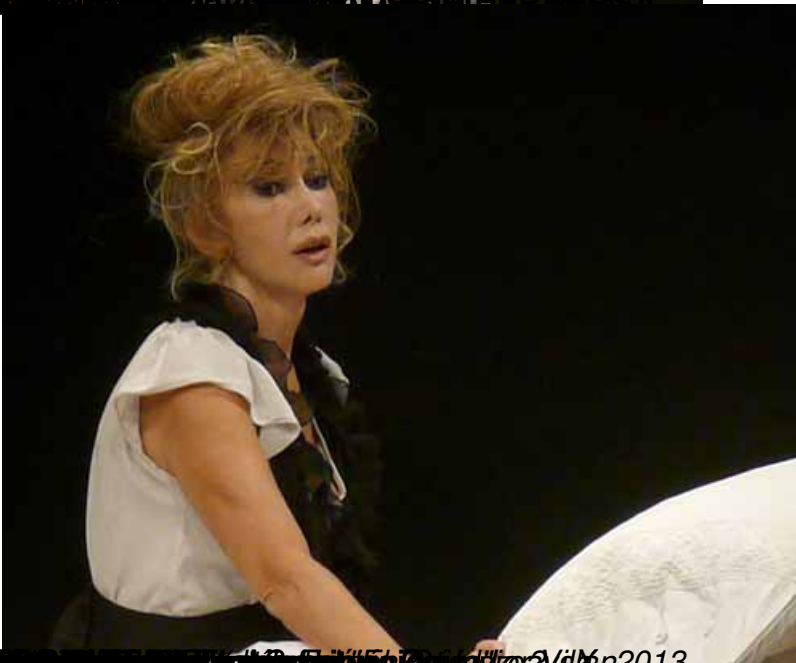
El poeta escénico, 1999, por el poeta escénico, 2013