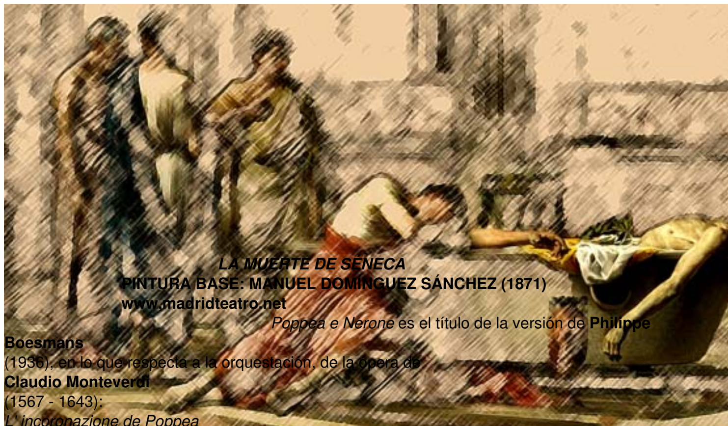
LA MUERTE DE SENECA PINTURA BASE: MANUEL DOMÍNGUEZ SÁNCHEZ (1871) www.madridteatro.net

Poppea e Nerone es el título de la versión de Philippe