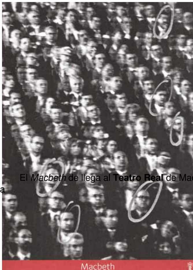
El Macbeth de Ilega al Teatro Real de Madrid.

Se trata de una Coproducción del 2008 de la Ópera de Novosibirsk y de la Ópera de París , estrenada en el 2009.