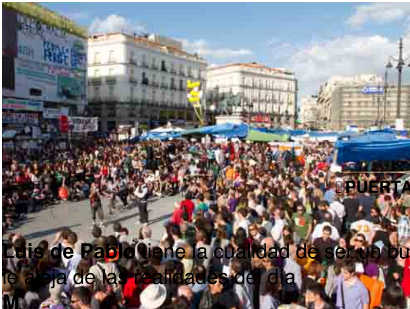
□ PUERTA DEL SOL. MADRID. 15 M

Luis de Pablo tiene la cualidad de ser un buen conversador y la música no le aleja de las realidades del día a día. Una de ellas es el 15