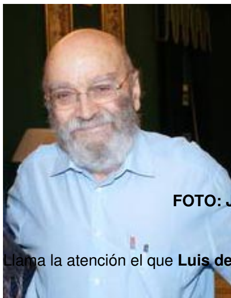
LUIS DE PABLO