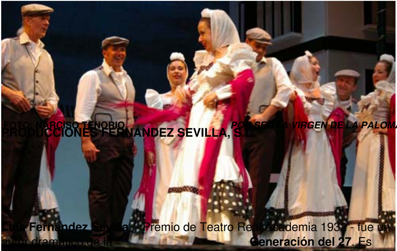
PRODUCCIONES FERNÁNDEZ SEVILLA, S.L. POR SEVILLA VIRGEN DE LA PALOMA...