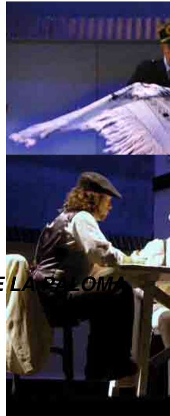
LA VERBENA DE LA SALOMA