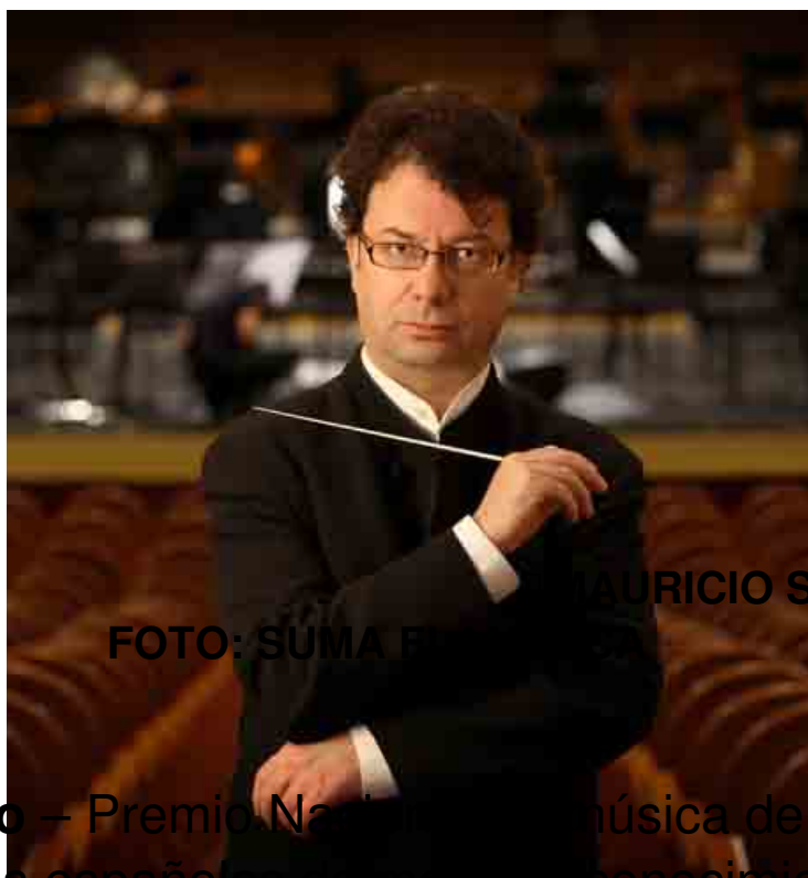
MAURICIO SOTELO

Mauricio Sotelo – Premio Nacional de Música de 2001 – es de los compositores españoles de mayor reconocimiento y rango internacional. Ha desarrollado un peculiar sonido musical que los críticos definen como “sabor añejo” y que en Europa se ha denominado