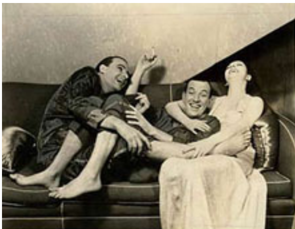
TEATRO ESTRENO 1933