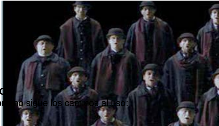
Escénicamente el Coro no sigue los caminos al uso:

Viernes, 09 de Diciembre de 2011 10:59 - Actualizado Viernes, 09 de Diciembre de 2011 12:24