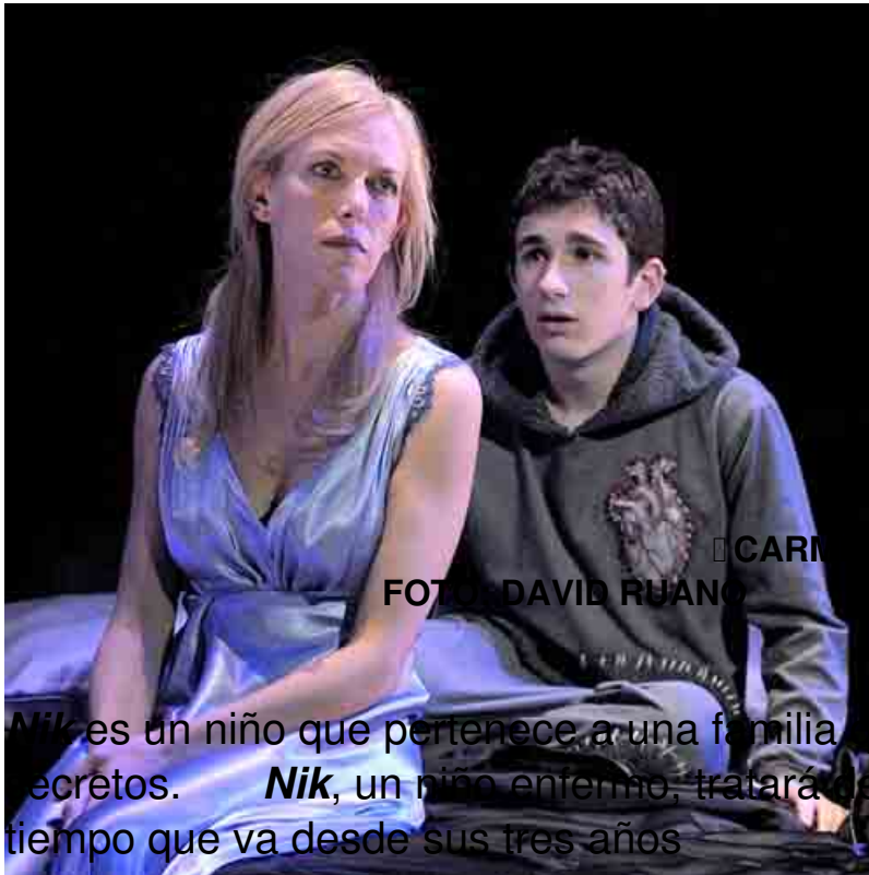
□ CARMEN CONESA / DAVID CASTILLO

Nik es un niño que pertenece a una familia que oculta una serie de secretos. Nik , un niño enfermo, tratará de descubrirlos en un espacio de tiempo que va desde sus tres años hasta los siete años.