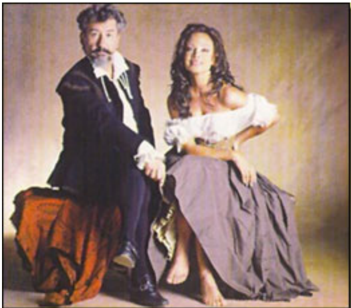
José Sacristán y Paloma San Basilio

Miércoles, 14 de Abril de 2010 14:56 - Actualizado Jueves, 13 de Mayo de 2010 13:47