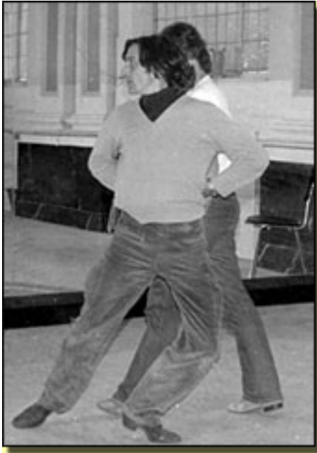
ANTONIO GADES