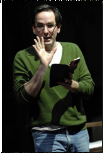
El hombre que se cayó del caballo (Cripple), Alcazra de Teatro