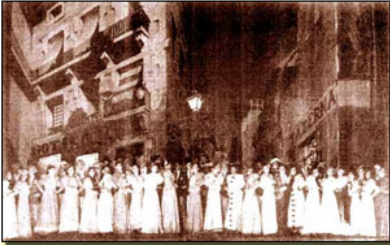
Por ser la Virgen de la Paloma Un mantón de la china-na-na

Jueves, 15 de Abril de 2010 10:37 - Actualizado Viernes, 14 de Mayo de 2010 12:24