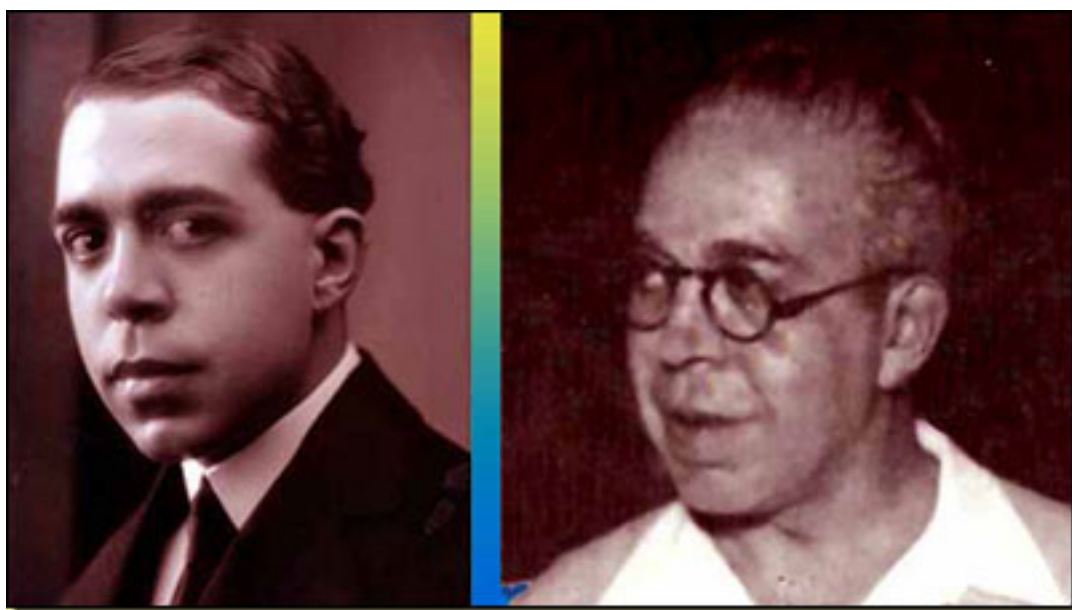
NÉSTOR DE LA TORRE (1887 – 1938)

El escenógrafo canario Ramón Sánchez Prat ha copiado los decorados en acrílicos para poder contemplarlos, mientras los auténticos reposan en un baúl en el Museo de Néstor .