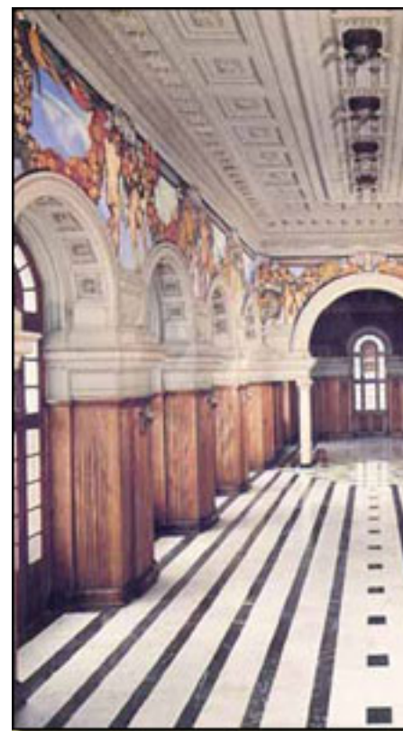
SALÓN SAINT SÆNS