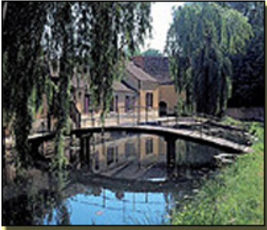
molino de Villeneuve

Jueves, 15 de Abril de 2010 10:31 - Actualizado Viernes, 14 de Mayo de 2010 12:26