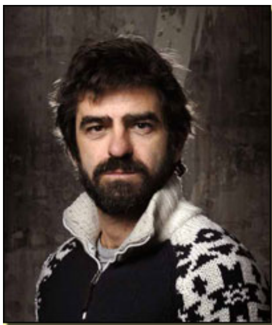
GONZALO CUNILL (JAVIER CERCAS)

En el libro, este camino Cercas es psicológico, y da al lector una sensación de acompañamiento consistente en