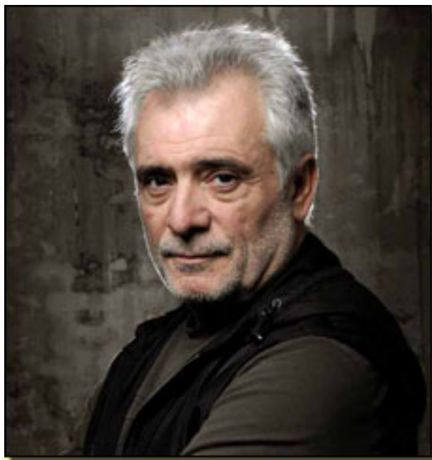
L. MARCO

Jueves, 15 de Abril de 2010 10:14 - Actualizado Viernes, 14 de Mayo de 2010 12:31