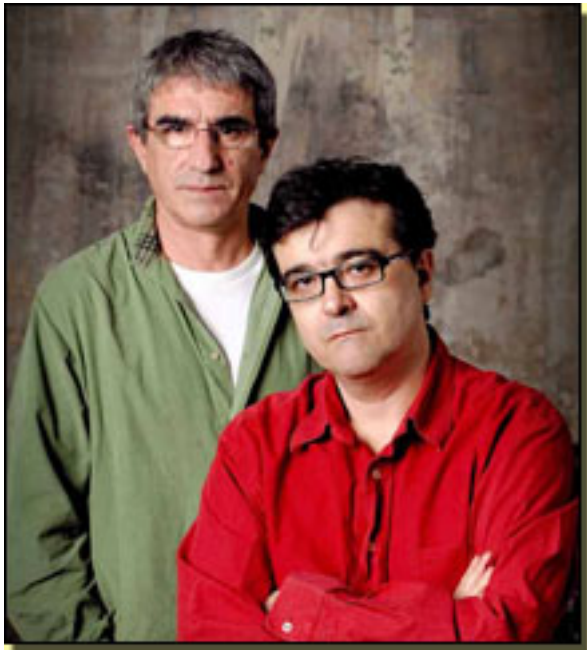
JOAN OLLÉ/ JAVIER CERCAS