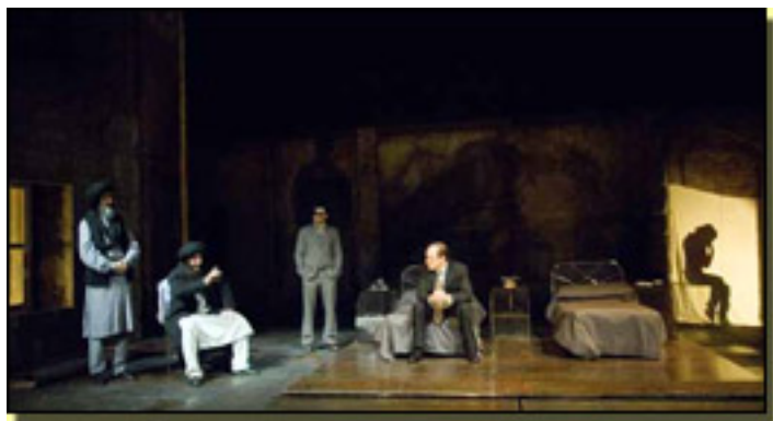
EN CASA/EN KABUL

Jueves, 15 de Abril de 2010 09:19 - Actualizado Viernes, 14 de Mayo de 2010 12:37