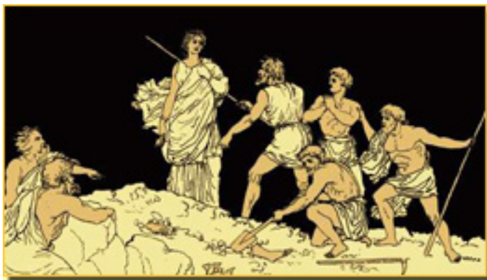
ANTÍGONA y el cuerpo de POLINICES

La ley y la sangre es la obra de mayor extensión en este volumen.