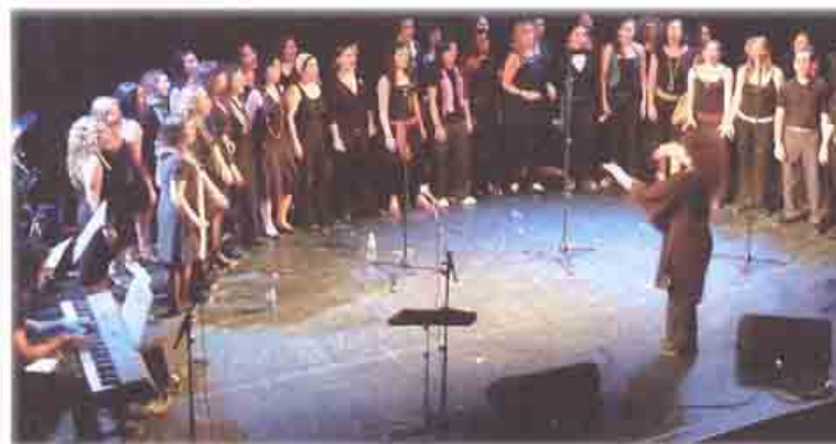
CORO DE GOSPEL Y MÚSICA MODERA UNIVERSIDAD COMPLUTENSE DE MADRID

En España se han creado Grupos Gospel . La diferencia de los españoles con los grupos americanos, según