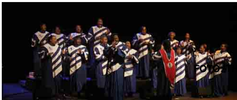
FO TO E MISSISSIPPI MASS CHOIR