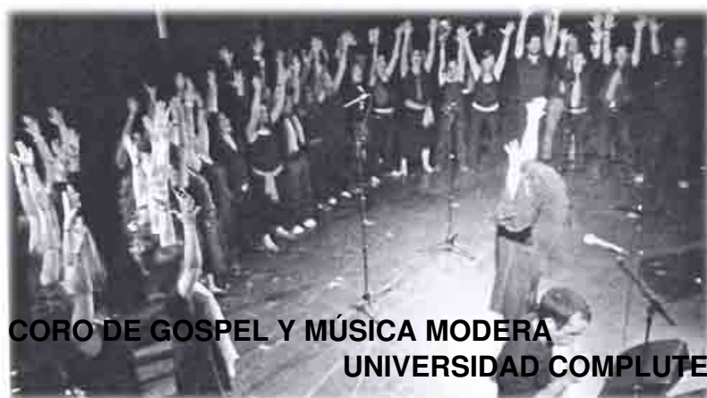
CORO DE GOSPEL Y MÚSICA MODERNA

Director Cultural de GECESA Obreros Socialistas