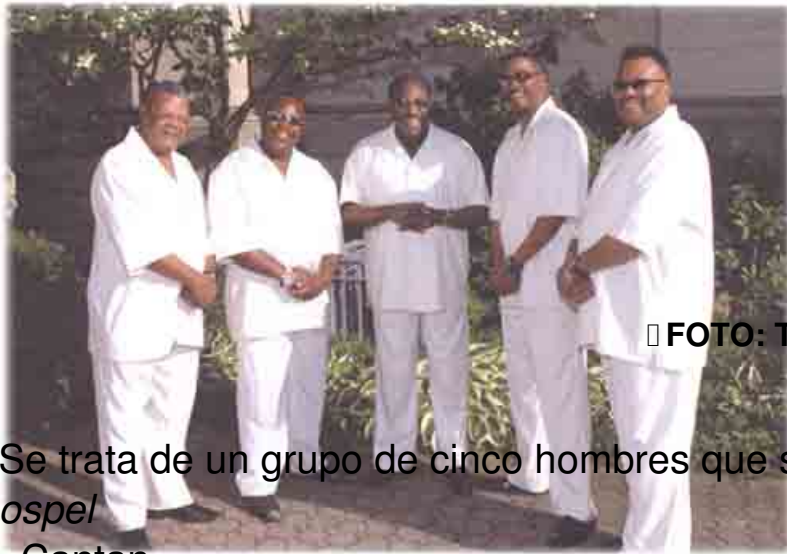
□ FOTO: THE BROTHEOOD SINGERS

Se trata de un grupo de cinco hombres que se mantienen en el tradicional Gospel