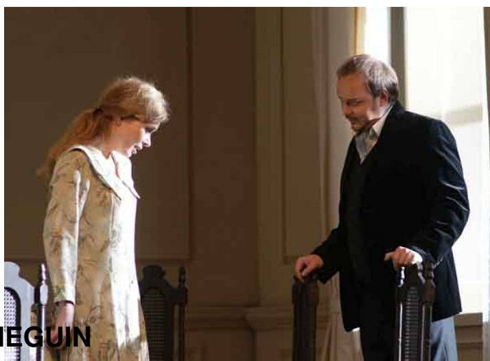
TATIANA / ONEGUIN

Dmitri Tcherniakov estructura los tres actos en dos espacios. El primero