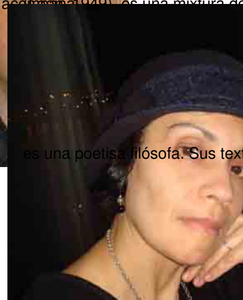
es una poetisa filósofa. Sus text