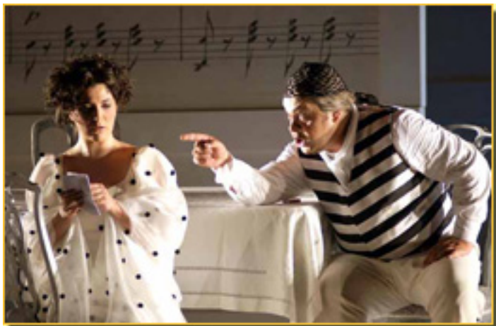
EL BARBERO DE SEVILLA

Sábado, 20 de Marzo de 2010 11:01 - Actualizado Sábado, 08 de Mayo de 2010 11:35