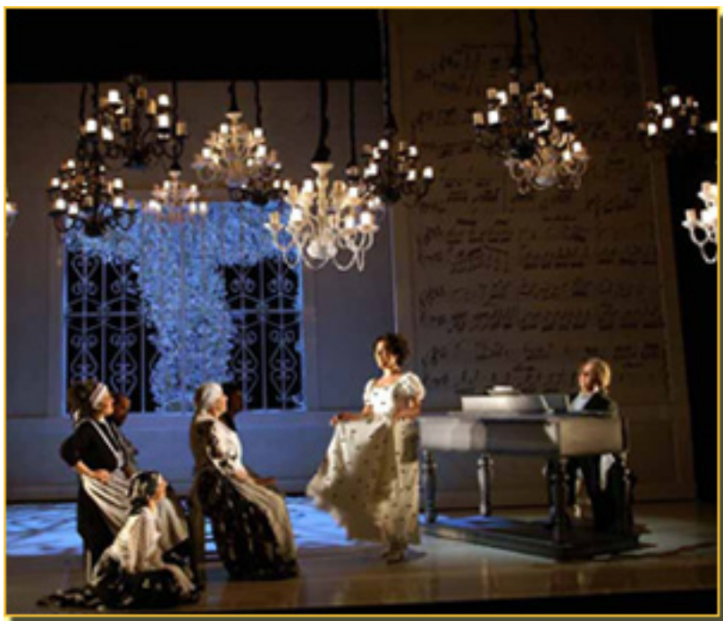
EL BARBERO DE SEVILLA