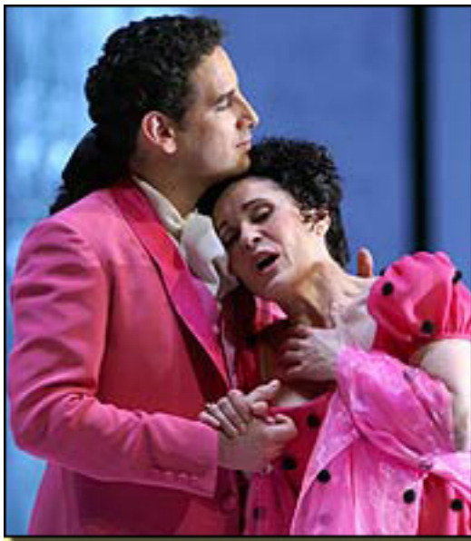
JUAN DIEGO FLOREZ/ MARÍA BAYO EL BARBERO DE SEVILLA (Versión de EMILIO SAGI)