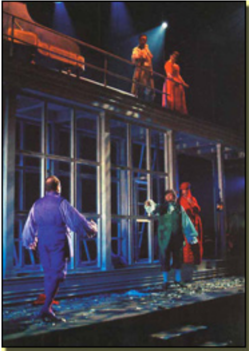
IL TUTORE BURLATO, 2006