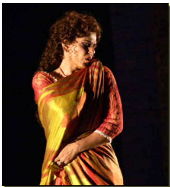
Il trovatore

- Cuando hay un texto, al leerlo cada vez puede ser distinto y traducir nuevos sentimientos, porque se lee con otrasensibilidad. Al mismo tiempo cada cantante traduce el texto de modo diferente y lo transforma. Hay que volver a integrar todo el conjunto. Incluso si fueran los mismos intérprtes, al llevarlo a otra ciudad, la comunicación sería diferente. Eso es lo que tiene el teatro. En este caso tengo otras personas, la orquestta es diversa, pero no menos bella. El modo de acercarse al mismo texto es diverso. □