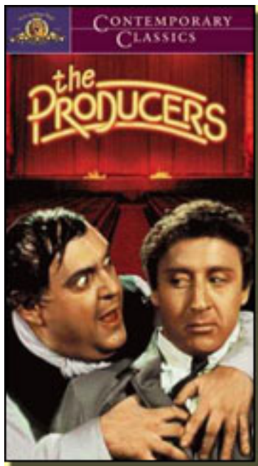
LOS PRODUCTORES (1968)

Miércoles, 17 de Marzo de 2010 19:47 - Actualizado Jueves, 06 de Mayo de 2010 17:17