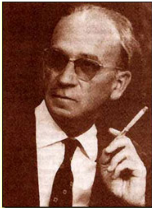
PABLO SOROZÁBAL

Queridos compañeros: me entera que se ha organizado, o se va a organizar, un homenaje a vosotros los que luchasteis por la zarzuela, aquel teatro que existía en la España civilizada. Hoy por desgracia tenemos mucha libertad pero no hay teatro lírico, ni autores, ni intérpretes ni público, se sigue moviendo el culo con la música de rok y berreando en inglés. En fin, para qué seguir. Yo llevo veinte años con mi mejor obra sin poder dársela a conocer... Vamos a ver si el Taller de Zarzuela hace el milagro y acaba educando líricamente a los españoles. Un abrazo a todos Pablo Sorozábal Octubre 1988