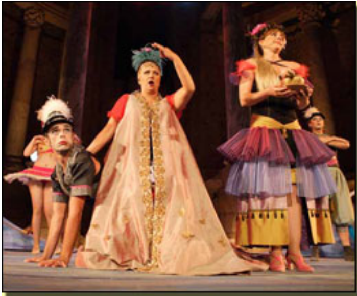
El joven Telémaco

Llegó a tener 33 representaciones seguidas y setenta y dos, durante la temporada. Llegó hasta los teatros privados como en el de la condesa de Montijo . Allí acudieron la infanta Isabel y su hija , los ministros de Brasil y de