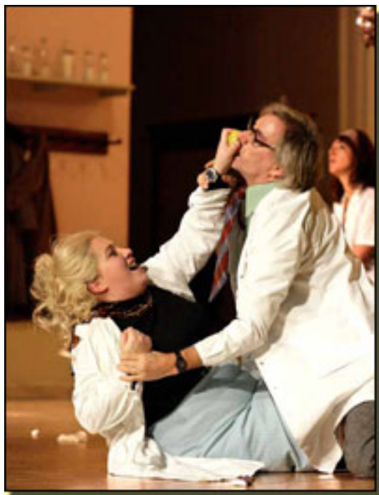
La historia de la empuñadura Marthaler