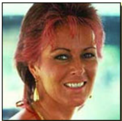
A de Anni-Frid Lyngstad