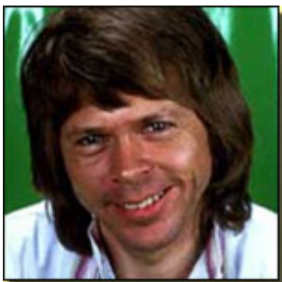
B de Björn Ulvæus