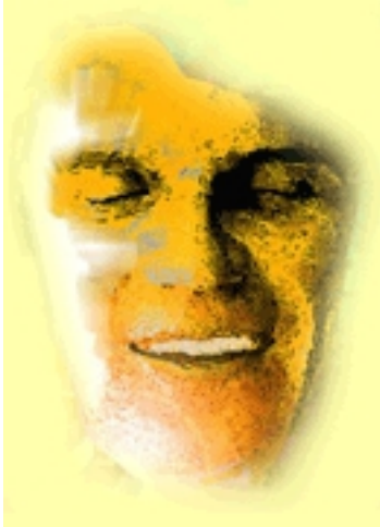
ILUSTRACIÓN PARA EL SECRETO DE LENA

Escrito por www.madridteatro.net Jueves, 13 de Mayo de 2010 11:34 -