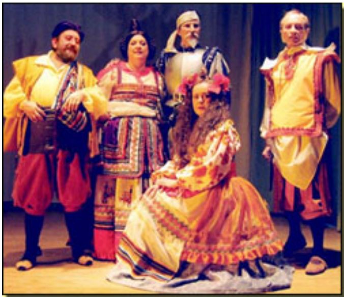
COMPañÍA DOBLÓN TEATRAL

■ A punto de apurar el IV Centenario del Quijote , llega al remodelado Galileo Teatro