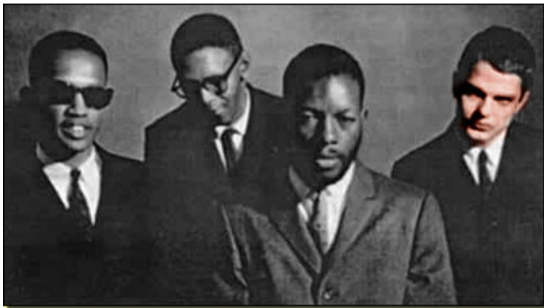
CHERRY – BLACKWEL – COLEMAN- HADEN

A finales de 1950 actúa junto a Ornette Coleman (Fort-Worth, 9 – III -1030), el cual liberó al jazz de estructuras cerradas agregando mayor libertad, rompiendo moldes armónicos y poniendo en solfa el concepto de armonía mediante cacofonías. Deja libertad para que sus músicos avancen por su cuenta. Esto llega al paroxismo es su disco Free Jazz .